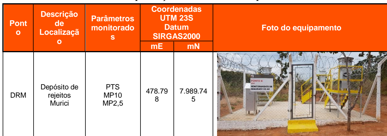
Tabela 4. 2. Especificação do monitoramento da qualidade do ar

A especificação do monitoramento é apresentada na Tabela 4.2, ao passo que a Figura 4.1 espacializa a rede de amostragem.